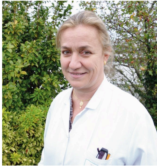
Irène Frachon est très attendue à La Réunion par les victimes du Mediator.

Certaines d'entre elles ont abouti. De quoi donner de l'espoir aux victimes qui attendent. "Il s'agira également de dégager des pistes d'amendement possible de notre droit pour mieux an-