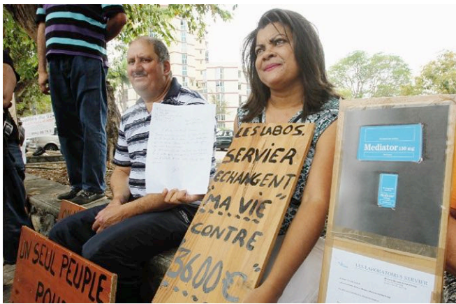
À La Réunion, des victimes du Mediator attendent des réponses.